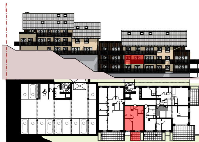
Plan de localisation