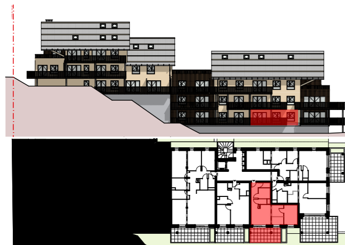
Plan de localisation