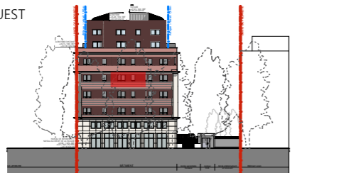
FAÇADE NORD OUEST